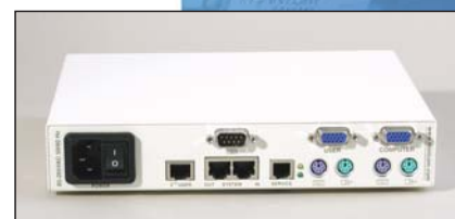
Phantom MX II Manager