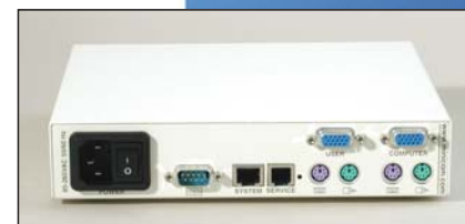
Universal Phantom universel