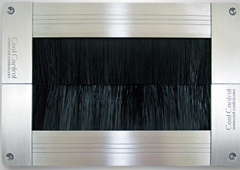
Abb. CoolControl Seal

Dichten, Kühlluftverlust um bis zu 63% verringern und sparen!