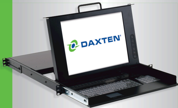
Abb.: RackAccess Tastaturschublade